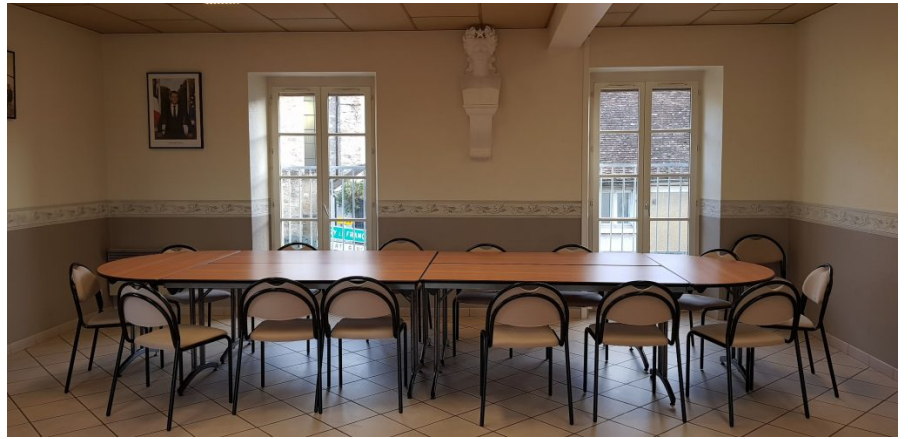
Salle du Conseil Municipal